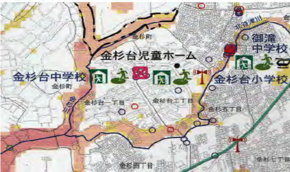
船橋市 洪水・内水ハザードマップ 2020.8作成から

今回は雨予報があったため、「金杉緑地」周辺はルートから外しましたが、団地周辺を回ってマルエツまでの往復、合計1万歩のDIGまち歩きになりました。参加頂きました19名の方、有難うございました。